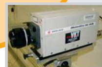
Film- und Messtechnik

Neugierig? Machen Sie sich doch selbst ein Bild von uns. Gerne stellen wir Ihnen unsere Dienstleistungen im Detail vor.