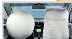
Team Airbag + Team Cockpit

Koordination der Zusammenarbeit verschiedener Teams am Beispiel verschiedener Crash-Tests