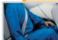
Team Gurte + Team Sitze